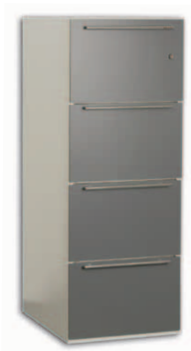
FC-40 E vetolaatikot grafiitinharmailla etupaneeleilla.

Uutuutena on koko vetolaatikon peittävä grafiitinharmaa paneeli mallissa FC-40E.