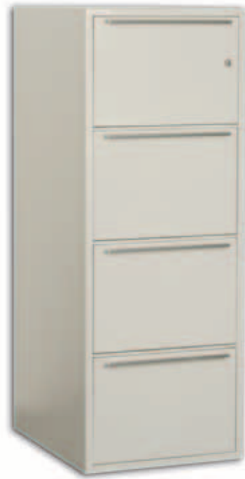
FC-40 C vetolaatikot ilman paneeleita.